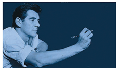
◀伯恩斯坦除了是指揮家，也是作曲家

伯恩斯坦 (Leonard Bernstein, 1918-1996) 是二十世紀美國的最大指揮家之一，還寫過很多交響曲和芭蕾舞劇。他更是一位教育家 and 電視名人，其「青年音樂會」系列演好幾個世代的兒童和青少年進入古典音樂的殿堂。今年是伯恩斯坦誕生一百周年，中大合唱團有限公司將於本月主辦「向偉大的伯恩斯坦——紀念伯恩斯坦誕生一百周年」音樂會，由香港中文大學合唱團演出全場伯恩斯坦作品，是次音樂會更被列為 Leonard Bernstein 於 100 周年全球慶祝活動之一。