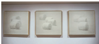
▲「草堆」光影的明暗虛實和韻