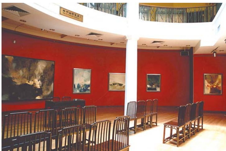
2004年香港大學「物我兩忘——朱德群繪畫」展覽。