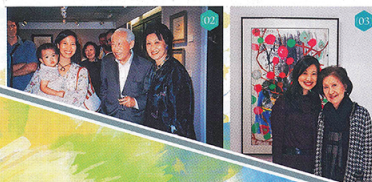
撰文: Jazz Chow

藝倡藝廊聯合創辦人兼首任主持人金董建平早於十年前逐步退下火線，交棒予女兒姚金昌玲(Daphne)掌舵，在畫廊昂然邁進35周年之際，Daphne早於兩年前開始籌備，匯集共35位畫壇大師的經典作品舉行盛大聯展，同時推出畫廊歷史專著，秉承Daphne母親向來致力推廣中國當代藝術的理念。