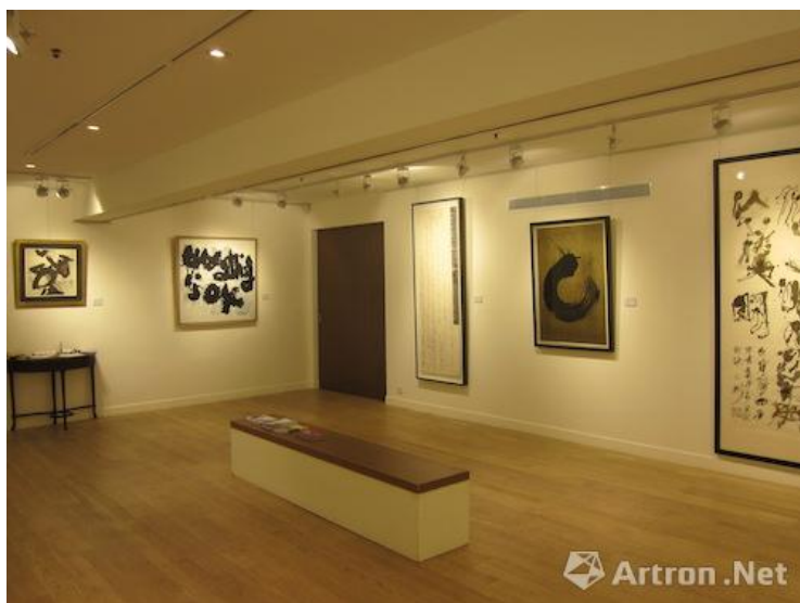
2009年从中环搬至香港仔的艺倡画廊将在不久的将来回归中环

至于各大拍卖行亦纷纷开设专门研究当代水墨的独立部门，令水墨艺术在这几年间的受关注程度大大提高。很多年轻艺术家重新对水墨感兴趣，亦引起年轻收藏家对水墨艺术品的极大兴趣，可能这是因为他们有着相近的语言。去年12月于香港举行的“水墨艺博”就是专门展示水墨艺术的博览会，我们画廊设展位其中，展出当代书法艺术家的作品，包括王冬龄、王天德、魏立刚、杨诩苍、冯明秋、古干、洛齐、储楚、法比恩·维迪尔。