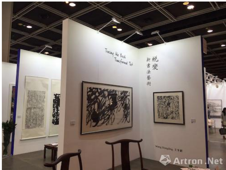
2015年12月香港首届“水墨艺博”上，艺倡画廊带来王冬龄的新作《乱书》

近几年，香港的艺术市场日益茁壮，发展迅速。与三十年前艺倡画廊刚开业时相比，现今已有许多国际级画廊入驻香港市场。香港作为一个自由贸易及国际大都会的城市，对于国际和本地的收藏家来说，自然是一个具有吸引力的目的地。